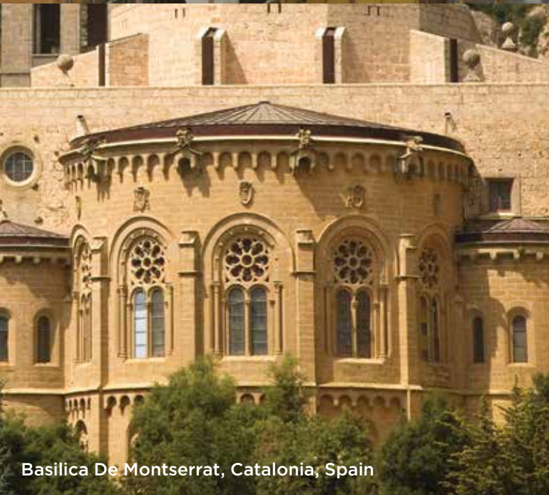
Basilica De Montserrat, Catalonia, Spain