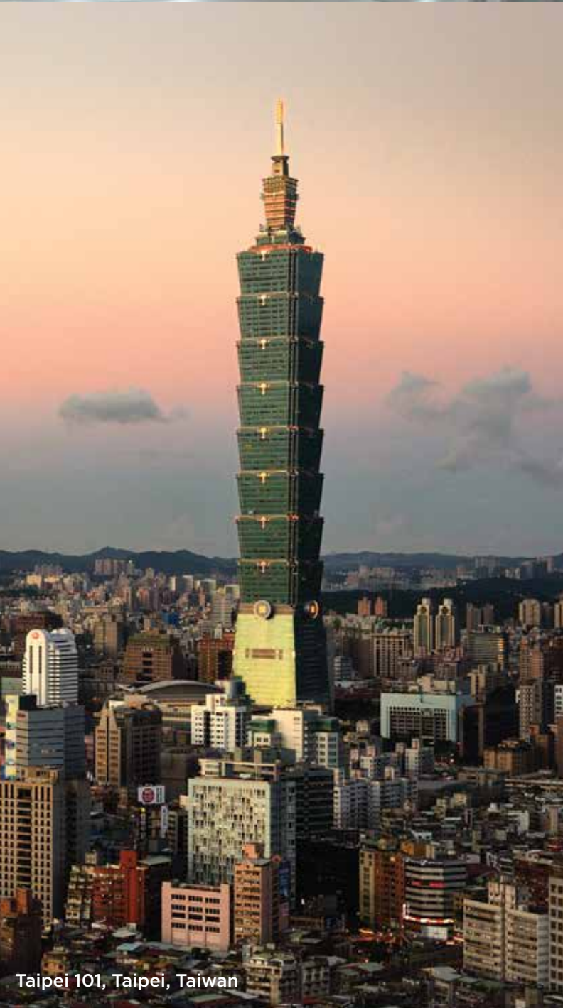
Taipei 101, Taipei, Taiwan