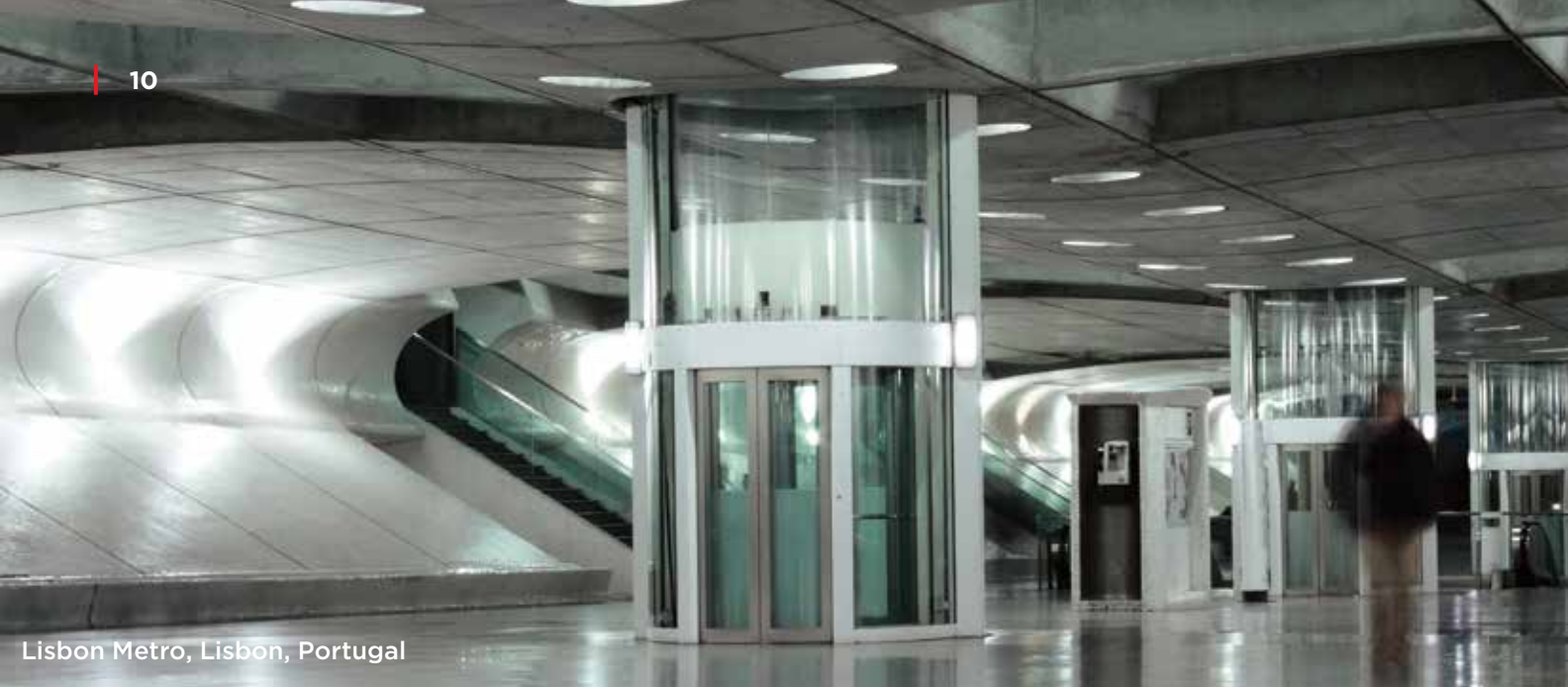
Lisbon Metro, Lisbon, Portugal