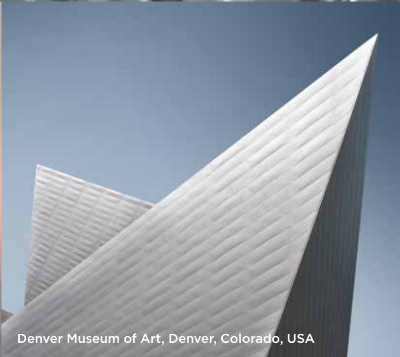
Denver Museum of Art, Denver, Colorado, USA